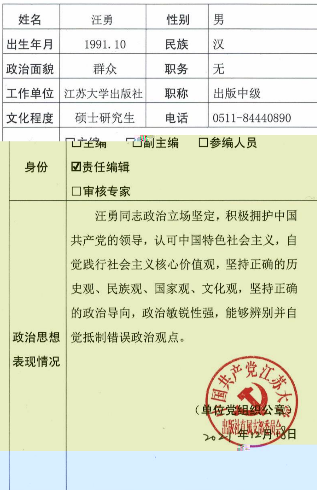
教材编写/责任编辑人员/审核专家政治审查表